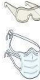
Óculos e Máscara