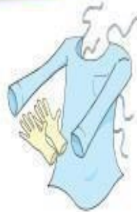
Luvas e Avental