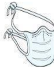
Máscara Cirúrgica (paciente durante o transporte)