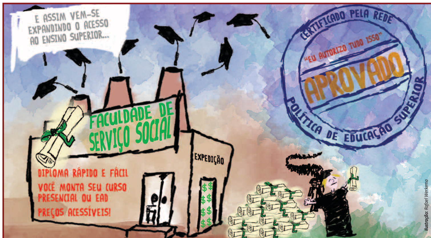
Ilustração: Rafael Werkeno

Esta é a viva expressão de um projeto de nação que não atende aos interesses das maiorias.